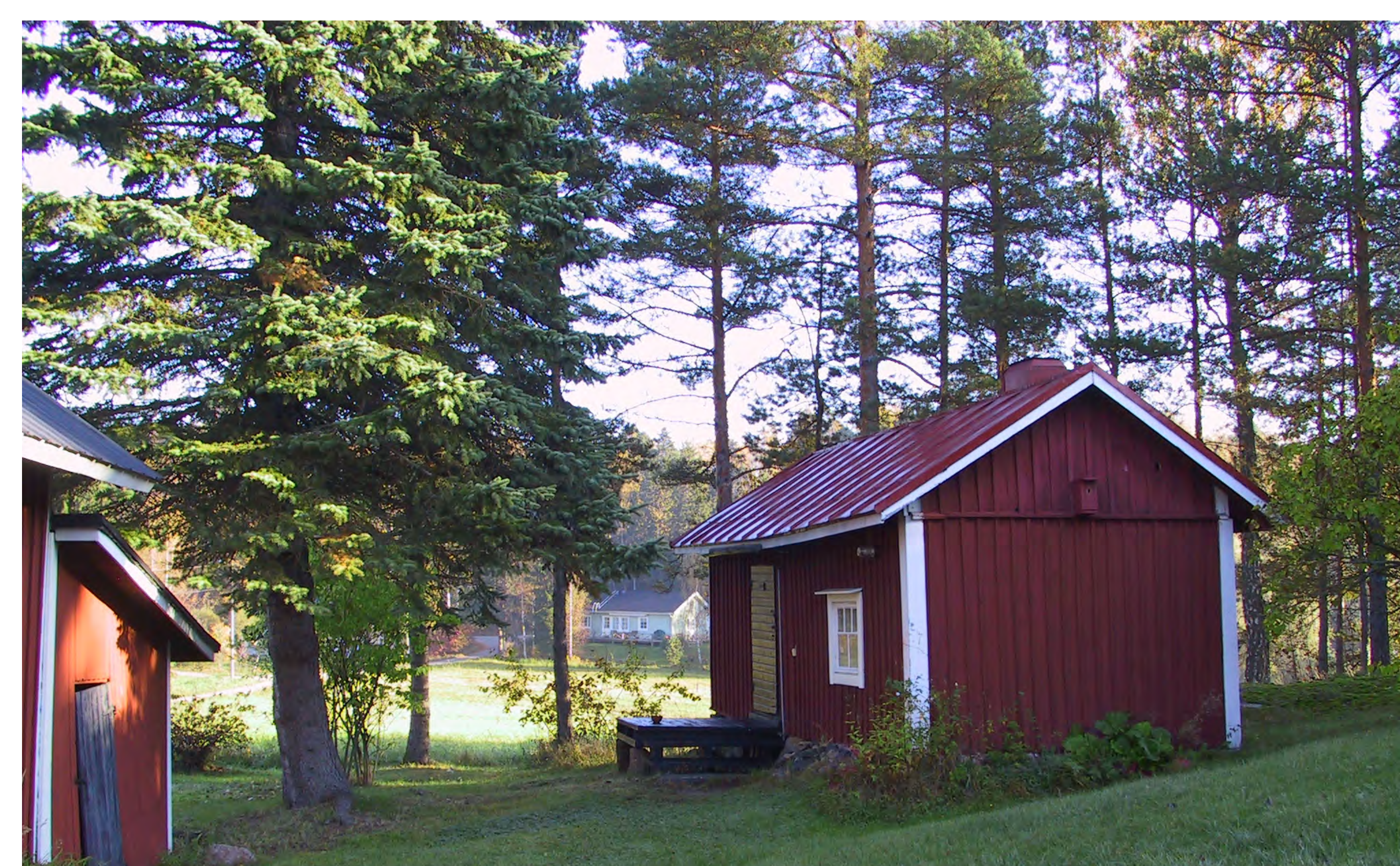
Sauna Mulbyn Björkbackassa. Bastu på Björkbacka i Mulby.

Mulby kuuluu Kurttilan kaupunginosaan, jossa myös Åminne on vanhaa Mulbyn aluetta. Mulbyssä ja Åminnessa kaupunkinimistön aiheina ovat monet mulbyläisten käyttämät paikannimet. Åminnen talon mukaan on nimetty katuja (Åminnentie, Åminnenranta). Puistonimi Uraalinrinne perustuu lasitehtaan asuintalon kutsumanimeen Uraali.