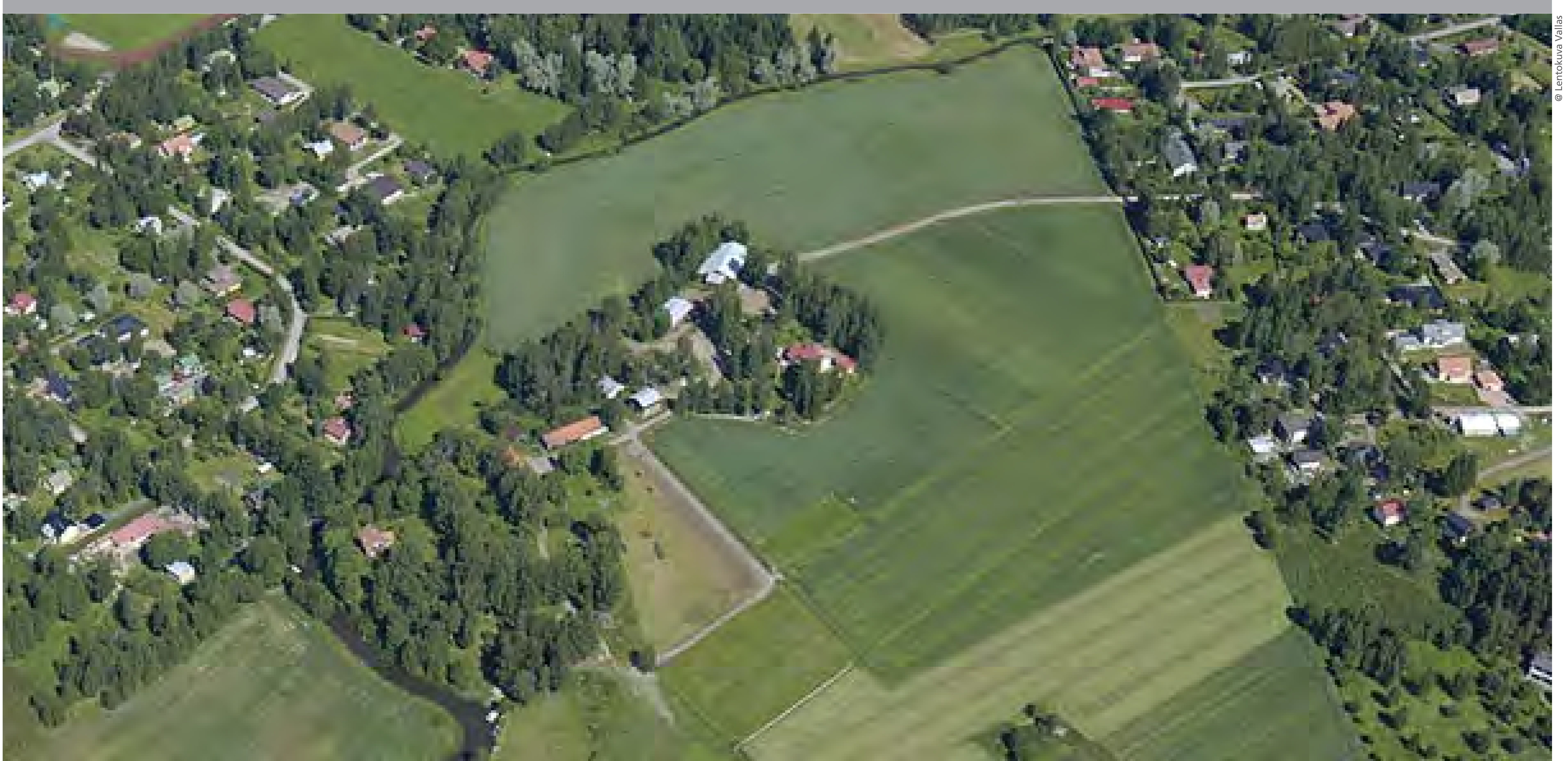
Övre Stenbackan viljamakasiini. Spannmålmagasinet på Övre Stenbacka.