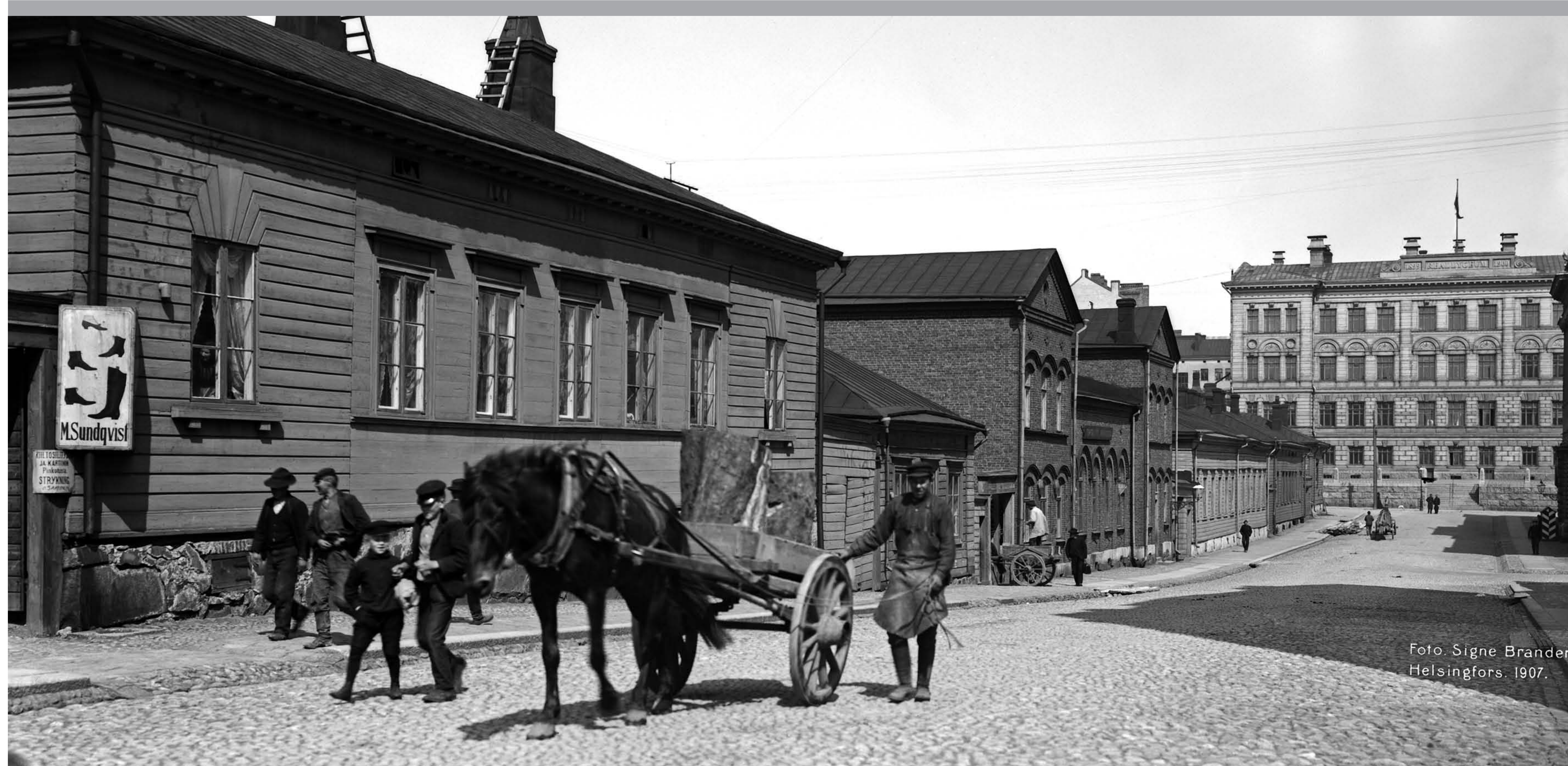
Helsingfors. 1907.