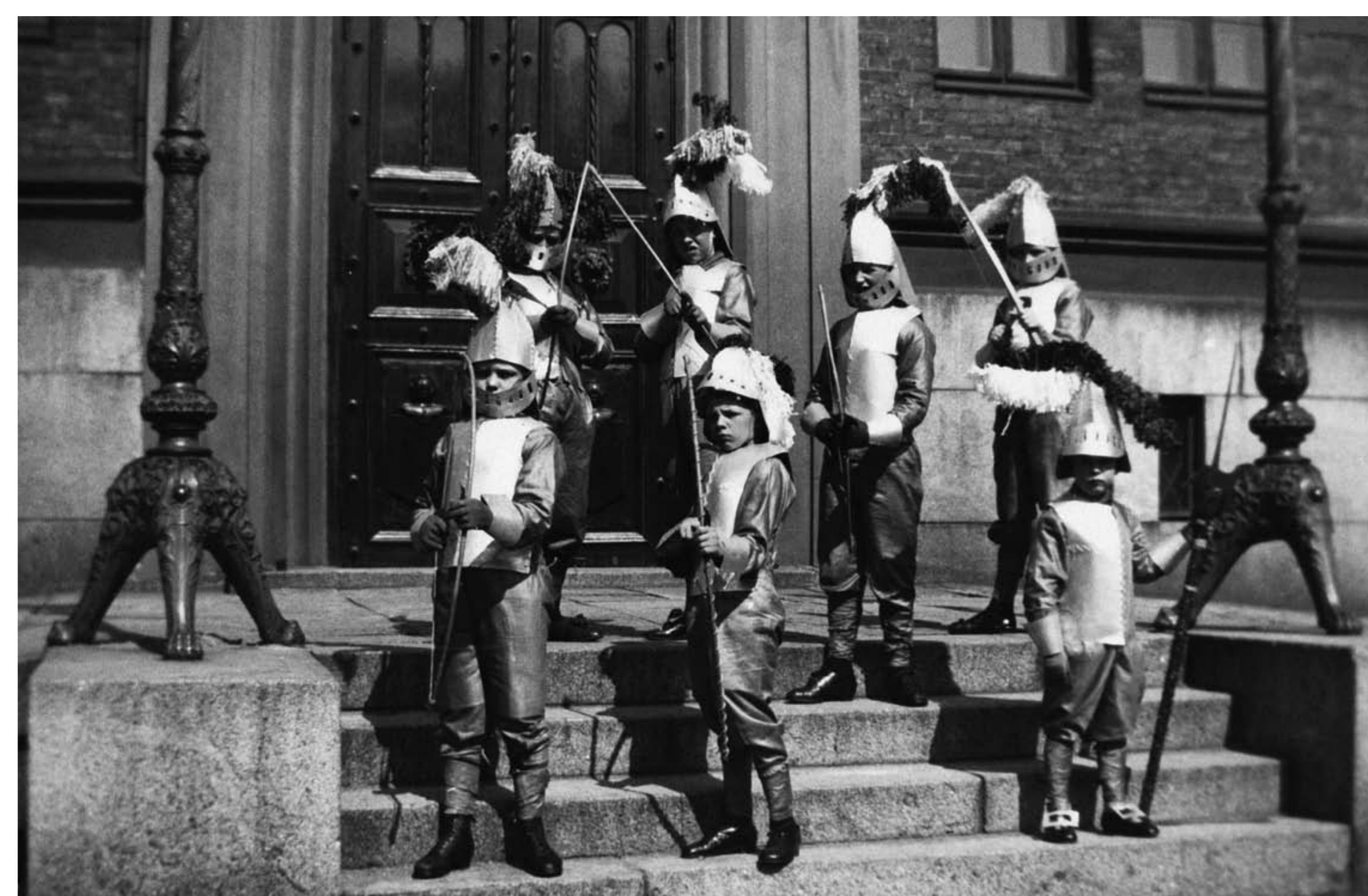
Lastenpäivät 11.5.1924. Osanottaja Ritarihuoneen portailla. Barnens dag 11.5.1924. Deltagare på Riddarhusets trappa.

I slutet av 1900-talet lyftes kvartersnamnen upp på nytt när de trendigt gammalmodiga namnen användes inom marknadsföringen och som identitetskapare för olika områden. När Fiskehamnen i Sörnäs byggs ut under 2010-talet kommer också nya kvartersnamn att komma till.