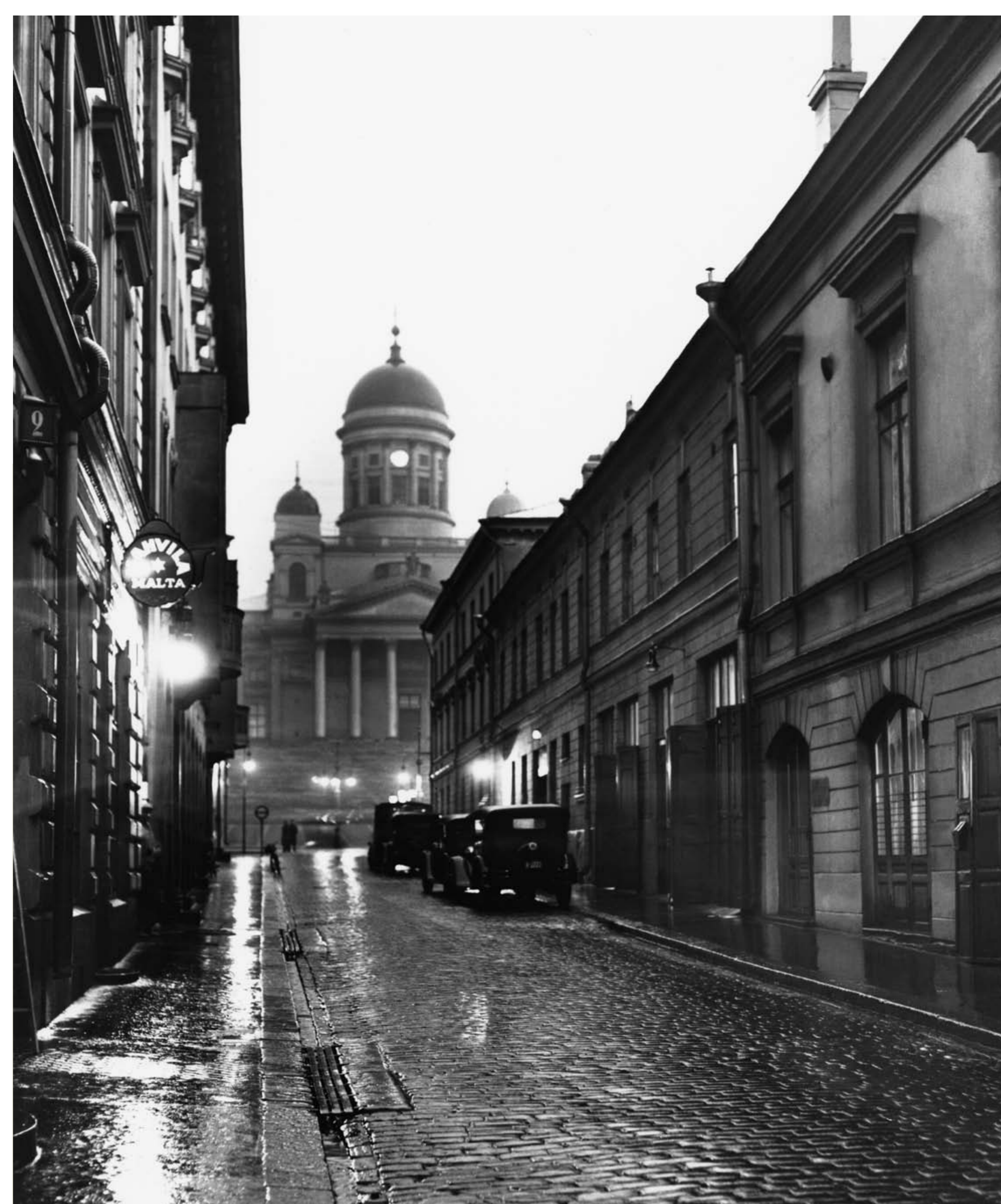
Sofiankatu. Vasemmalla Kahvila Malta, taustalla Tuomiokirkko. R. Roos 1930 Sofiegatan. Caféet Malta till vänster, domkyrkan i bakgrunden. R. Roos 1930