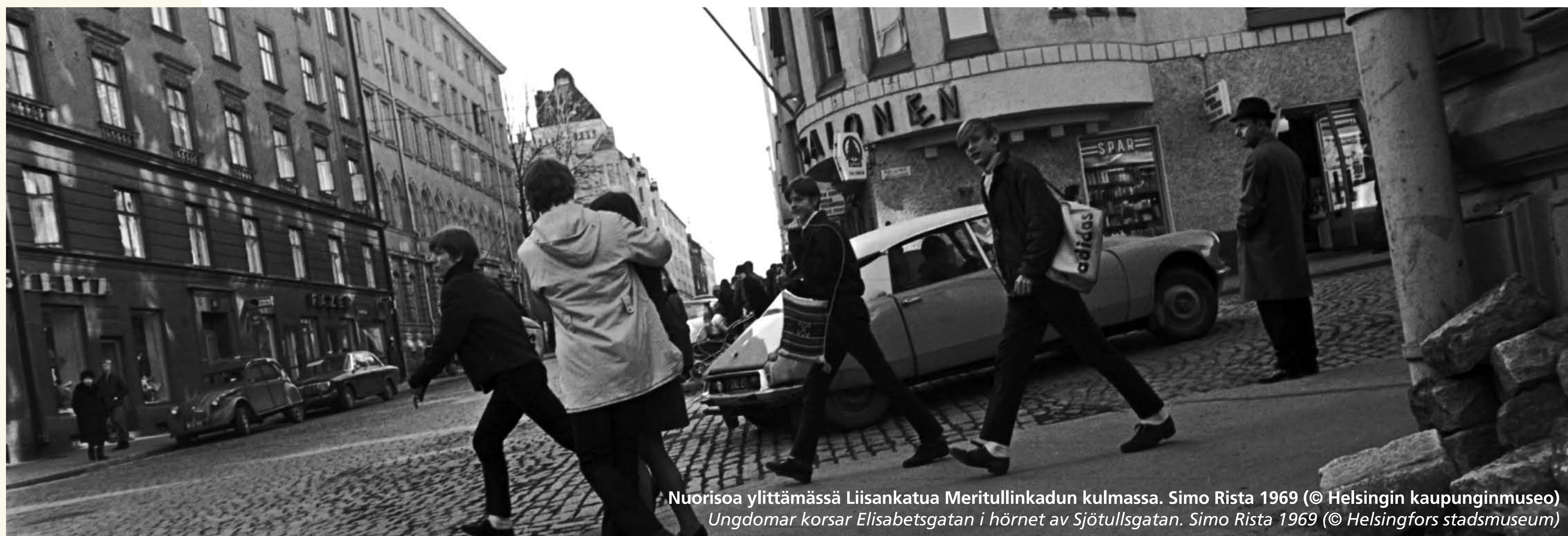
Nuorisoa ylittämässä Liisankatua Meritullinkadun kulmassa. Simo Rista 1969 (© Helsingin kaupunginmuseo) Ungdomar korsar Elisabetsgatan i hörnet av Sjötullsgatan. Simo Rista 1969 (© Helsingfors stadsmuseum)

Kruununhaassa on runsaasti muistonimiä eli nimiä, jotka on annettu tietoisesti jonkun kunniaksi tai muistoksi. Kadunnimet Helenankatu, Kristianinkatu, Mariankatu ja Sofiankatu ovat 1800-luvulta. Nikolainkadun nimi muutettiin Snellmaninkaduksi 1928.