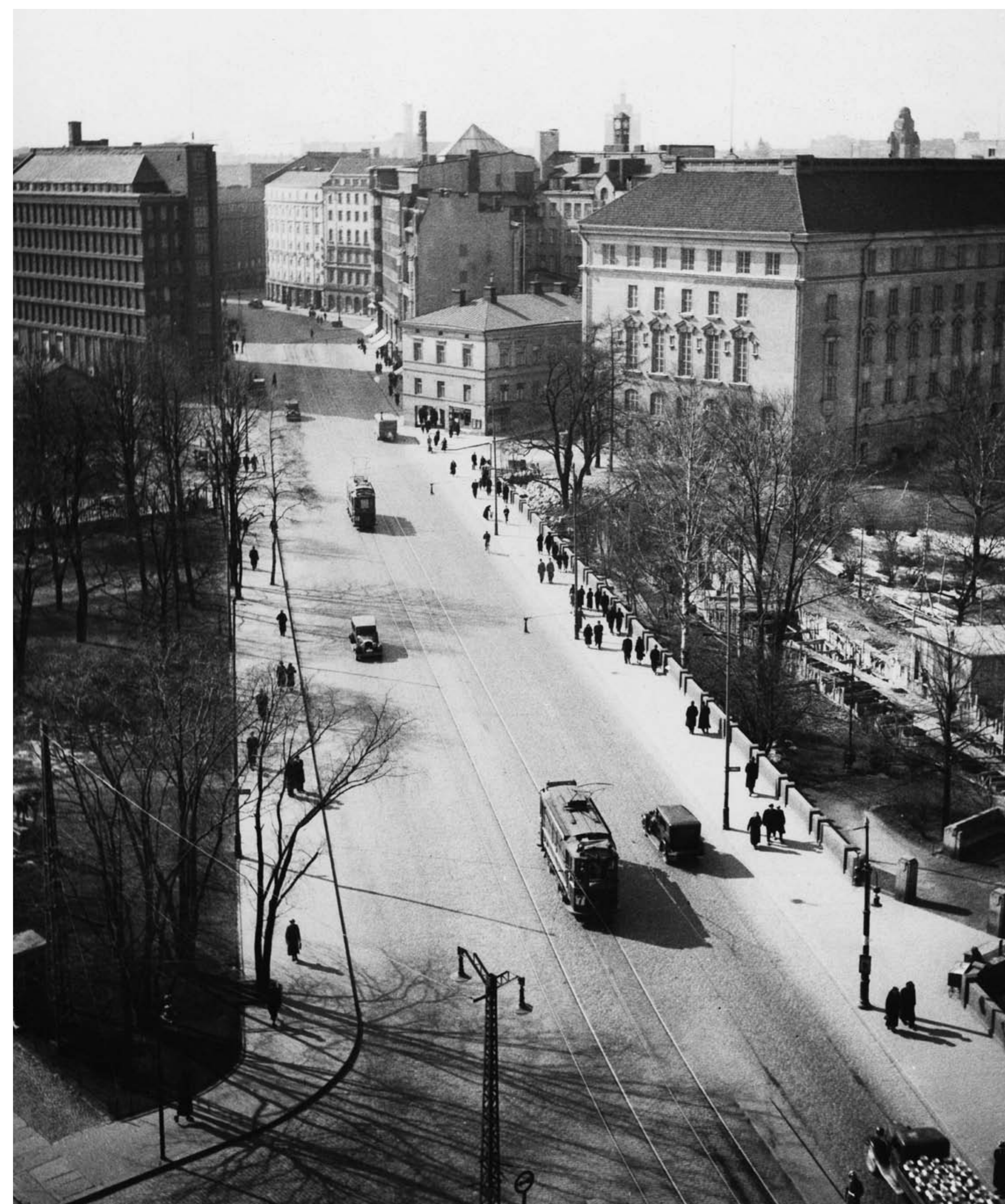
Näköala Liisankatu 29 - Unioninkatu 39:n katolta etelälounaaseen Kaisaniemenkadulle. Vy över Kajsaniemigatan i riktning sydsydväst. Fotografen står på ett hustak i korsningen av Elisabetsgatan och Unionsgatan.