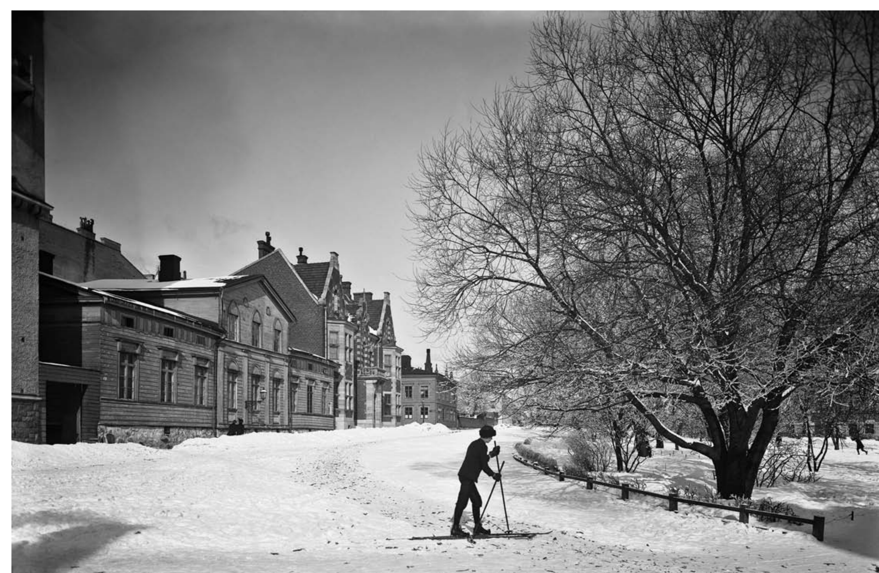
Maurinkatu. Liisanpuistikko oikealla. Mauritzgatan. Elisabetsskvären till höger.

De äldsta officiella gatunamnen i Helsingfors som fortfarande används är Unionsgatan och Elisabetsgatan i Kronohagen. Namnen gavs i samband med kejsar Alexander I:s besök i Helsingfors år 1819. Gatorna fick finska namn något senare. Elisabetsgatan är namngiven efter Alexander I:s maka, kejsarinnan Elisabet.