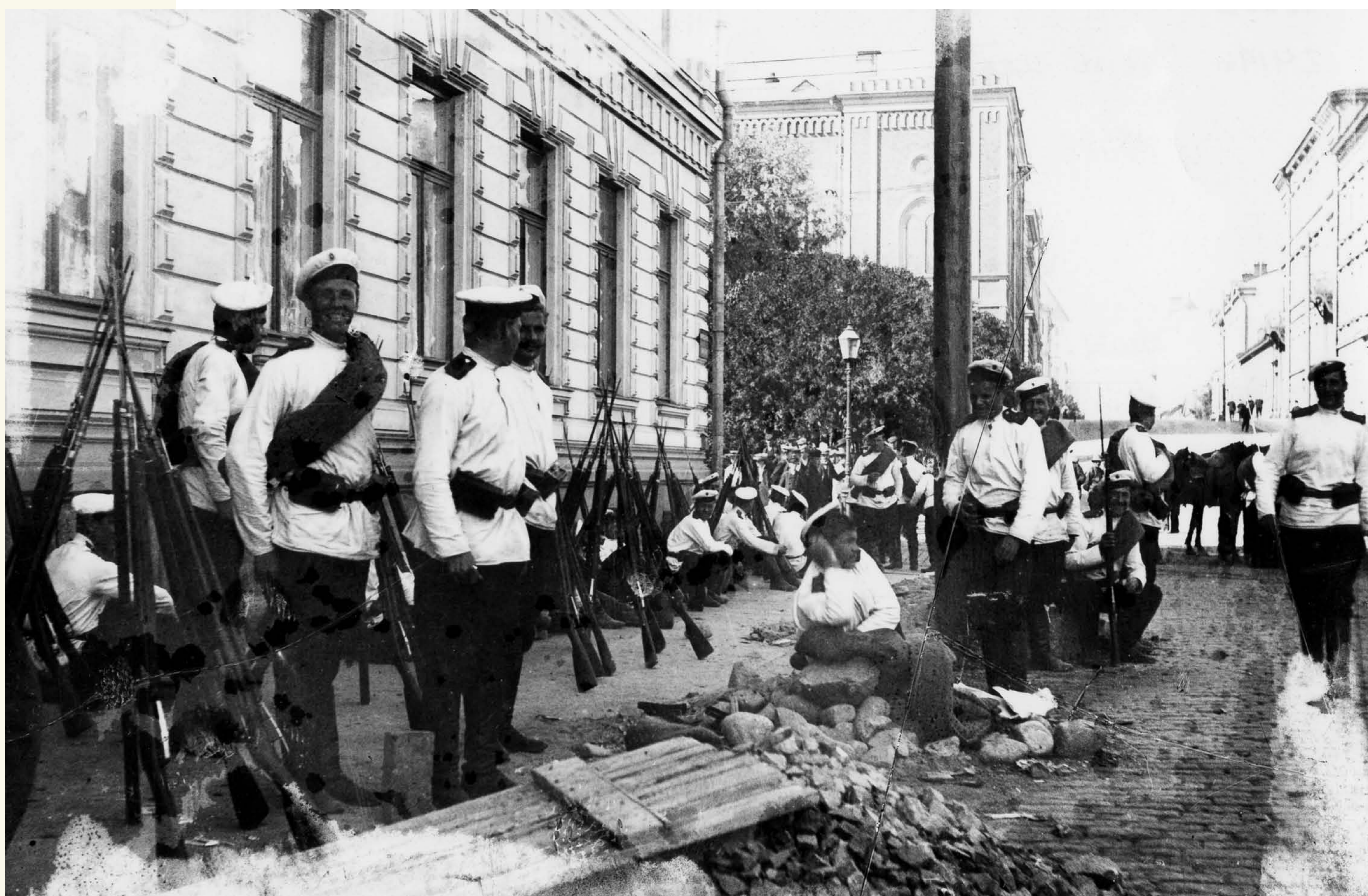
Viaporin kapina. Venäläistä jalkaväkeä Mariankadun ja Aleksanterinkadun kulmassa 31.7.1906. Upproret på Sveaborg. Ryskt manskap i hörnet av Mariegatan och Alexandersgatan 31.7.1906.

Gator kan också få namn efter händelser. I många finländska städer finns till exempel en gata med namnet Fredsgatan. I Helsingfors gavs namnet Fredsgatan på 1800-talet till minne av freden i Fredrikshamn år 1809. Också föreningar och företag har utgjort motiv för gatunamn. Bokarbetaregatan (1945) har fått sitt namn för att Helsingfors bokarbetarförenings verksamhetshus ligger vid gatan.